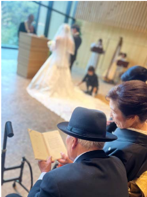
讚美歌の譜面は麻痺した右手の代わりに、奥様と2人で広げて、お祝いされています。

令和5年に入り、ご利用者様から孫の結婚式に参加するアテンドの話をいただいております。しかし脳梗塞再発により入院となった経緯を経て、体力的な事を考慮し、関係者は一度は諦めていたのが本音です。当日は奥さんと普段通り家で過ごされるのかと考えておりました。