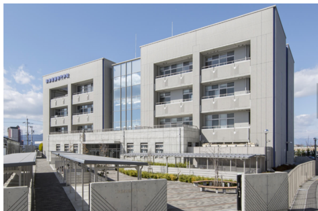
代表、大森の母校、草津看護専門学校

いつか訪問看護に職場にしてくれる看護学生が生まれたりいいな！と思いつつ、今年も楽しく取り組ませていただきました！